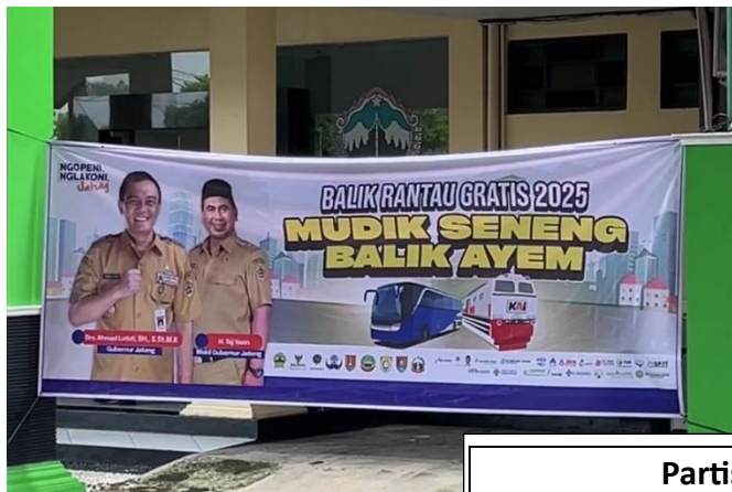
Partisipasi SPJT Program Balik Rantau Gratis, Aman dan Nyaman untuk Masyarakat.