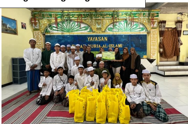
SPJT Tebar Kepedulian, Hadirkan Kebahagiaan.

Sebagai Badan Usaha Milik Daerah (BUMD), PT Sarana Pembangunan Jawa Tengah (SPJT) senantiasa menempatkan kebermanfaatannya bagi masyarakat, khususnya masyarakat Jawa Tengah, sebagai bagian penting dalam pelaksanaan kegiatannya. Sejak awal berdiri, Perseroan tidak hanya berorientasi pada pencapaian kinerja usaha, tetapi juga berkomitmen untuk memberikan kontribusi nyata terhadap pembangunan daerah serta peningkatan kesejahteraan masyarakat secara berkelanjutan.