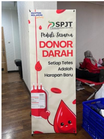
Semangat Berbagi dengan Aksi